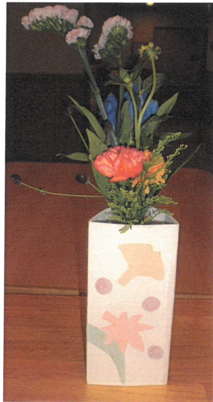
デイ 一輪挿し作り