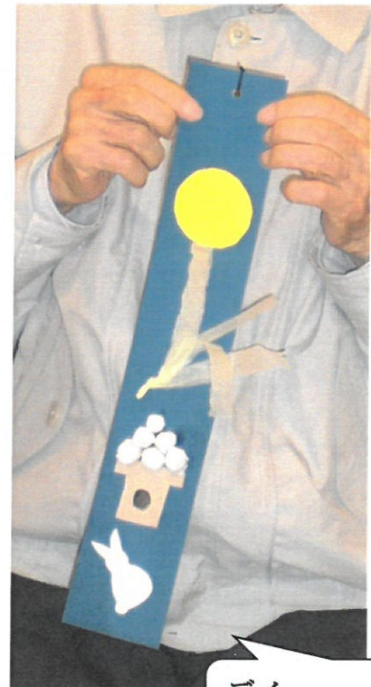
デイ お月見吊るし飾り