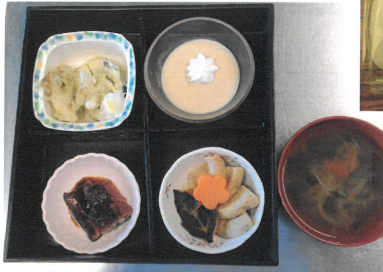
特養 9/21 敬老のお祝い