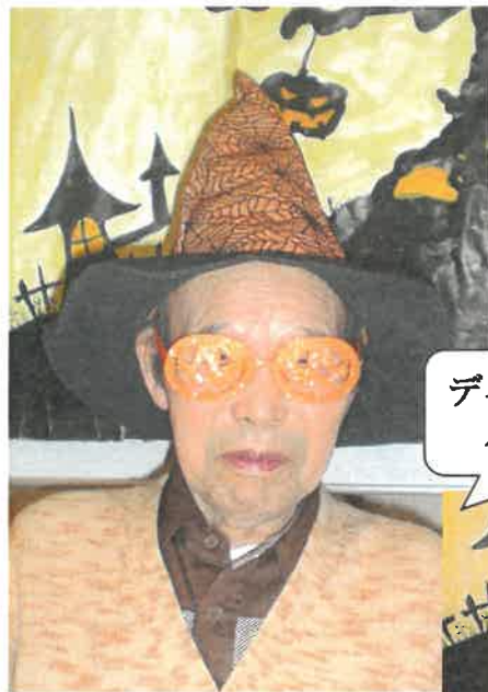
デイ ハロウィン仮装