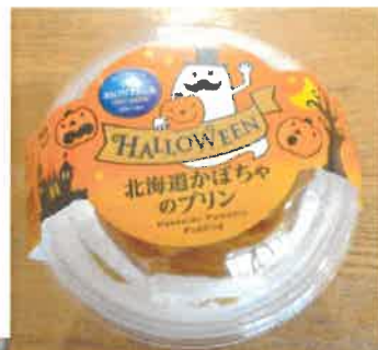
特養 ハロウィンパーティー