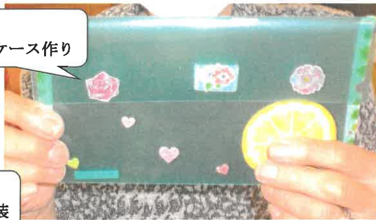
デイ マスクケース作り