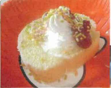
特養 クリスマス会