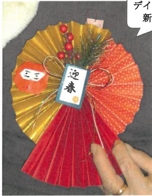
デイ 新年飾り作り