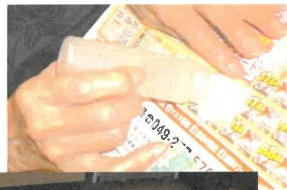
デイ 花籠小物入れ作り