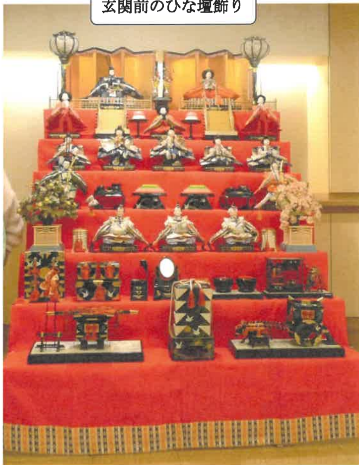
玄関前のひな壇飾り