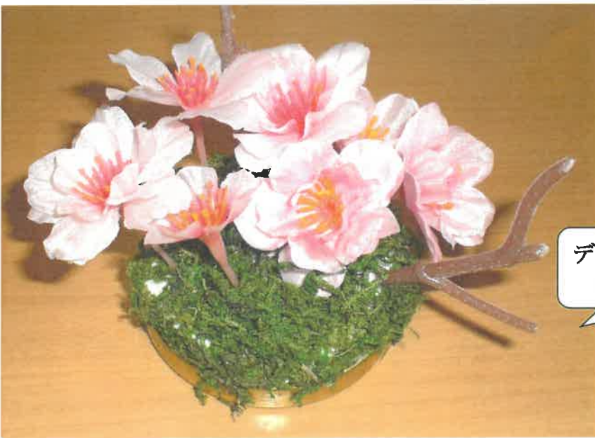
デイ 桜のマグネット作り