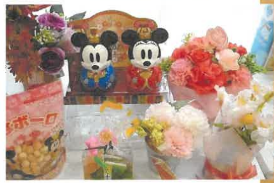
特養 ひな祭りレク