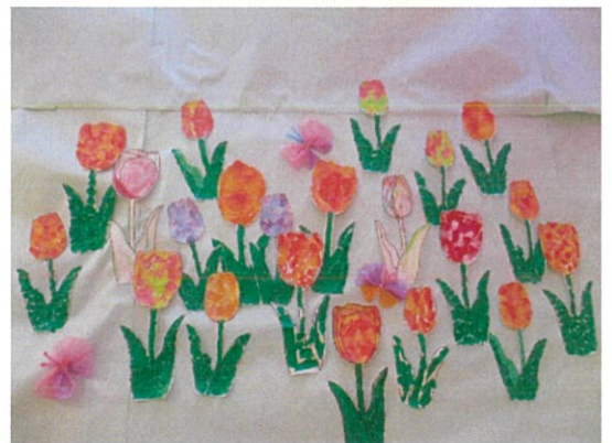
書道はチューリップのちぎり絵 手芸はクローバーの置き飾り作り 園芸は花の植え替えと散歩 皆さん好きなクラブに入り活動されました。