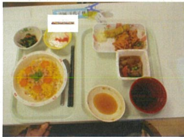
4月8日は花まつりの日です。 昼食はちらし寿司と春のかき揚げ おやつは桜練りきり 美味しいと好評でした。!(^^)!