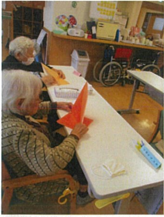
制作で大きな折り紙で鶴を折ったり、サボテンを作りました。 かわいく出来ました。(^^)