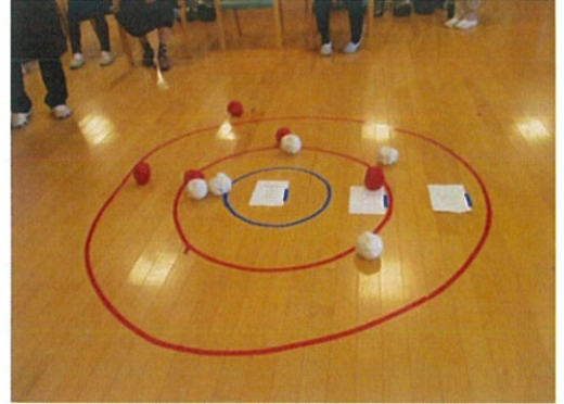
ゲームをして楽しめました。