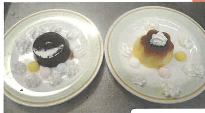
特養 誕生日会 フルーツポンチやプリン