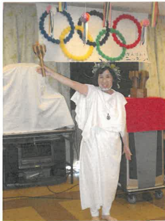
デイ サマーパーティー