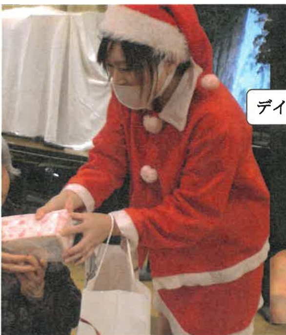
デイ クリスマス会