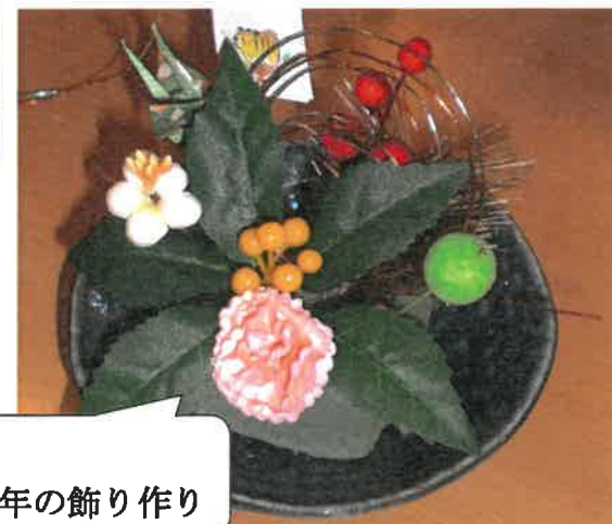
デイ 新年の飾り作り