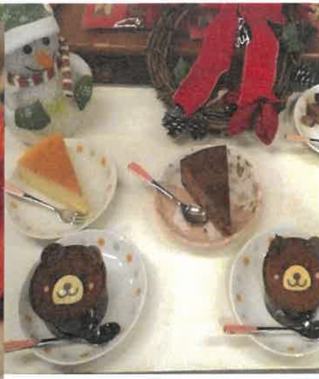
クリスマスプレゼント