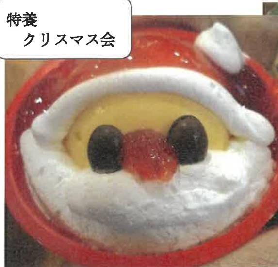
特養 クリスマス会