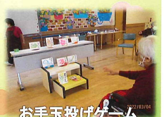
お手玉投げゲーム