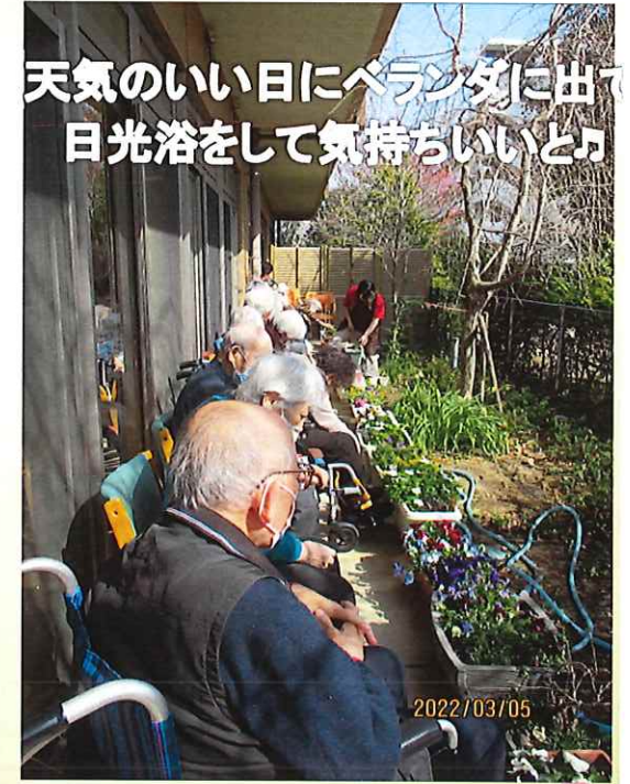
天気のいい日にベランダに出て 日光浴をして気持ちいいと♪