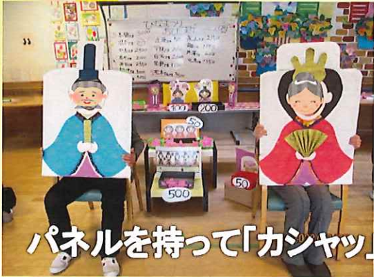
パネルを持って「カシャッ」

昼食は海鮮丼で、皆さんペロリと召し上がっていました。 ひな祭りゲームをしたり、パネルを持って写真を撮りました。 おやつはさくらゼリーと甘酒 甘納豆がでてニコリ♥ 甘酒は久々に飲んで 美味しかったと