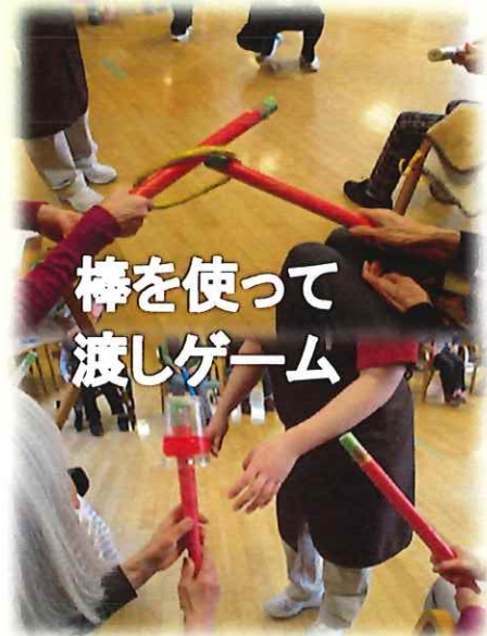
棒を使って 渡しゲーム