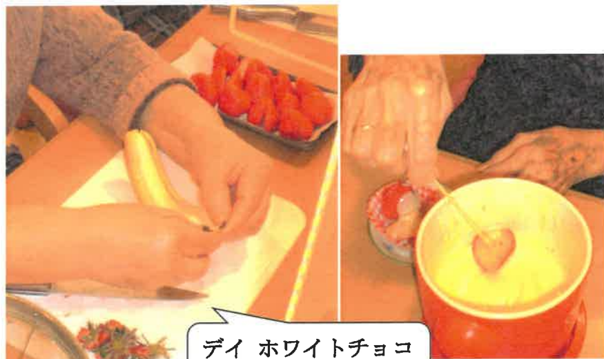
デイ ホワイトチョコ フォンデュ作り