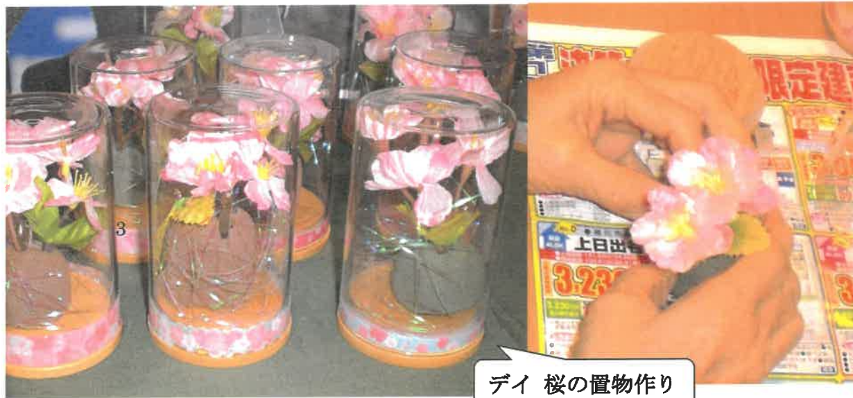
デイ 桜の置物作り