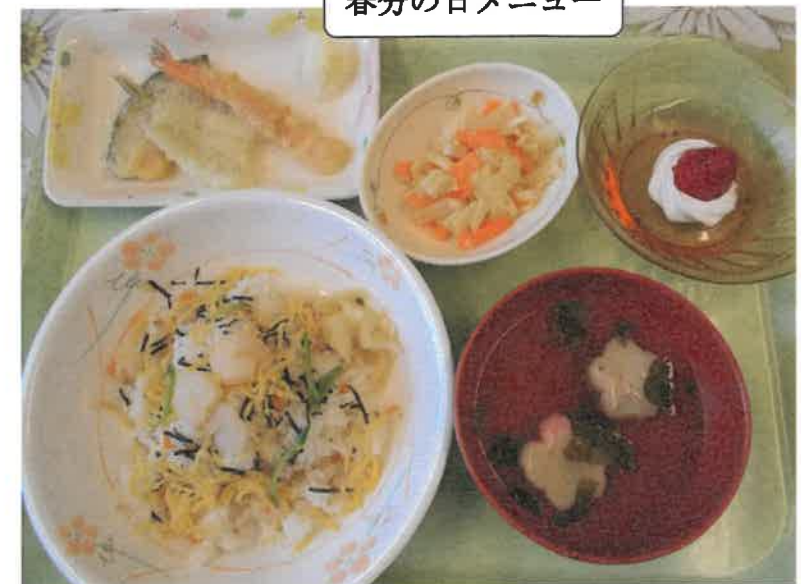
春分の日メニュー