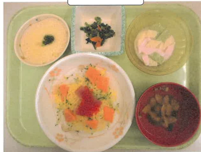
ひな祭りメニュー