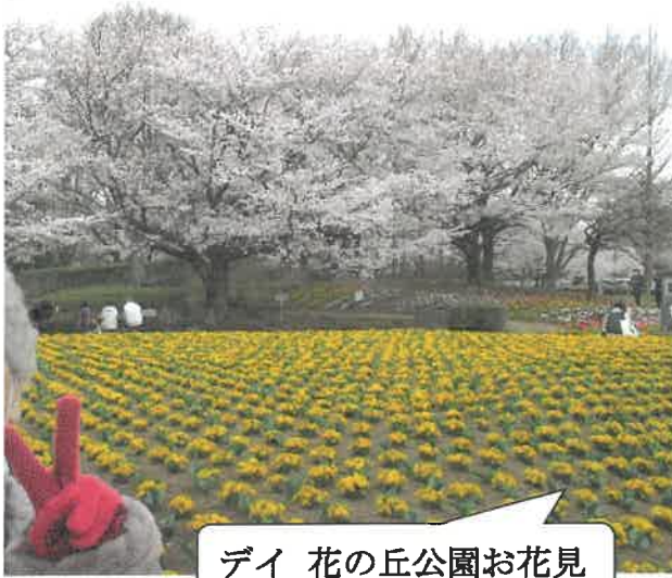
デイ 花の丘公園お花見