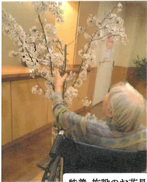
特養 施設のお花見