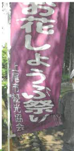
デイ 丸山公園散策