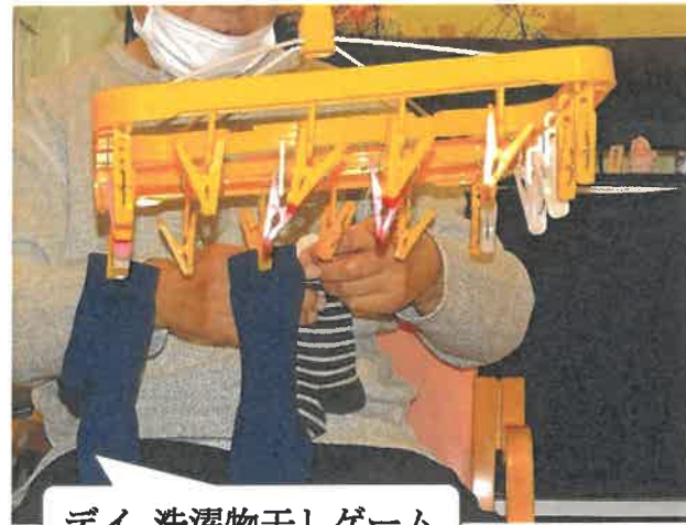
デイ 洗濯物干しゲーム