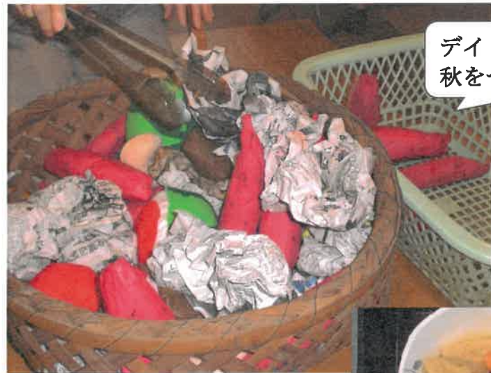
デイ 秋をつかもうゲーム