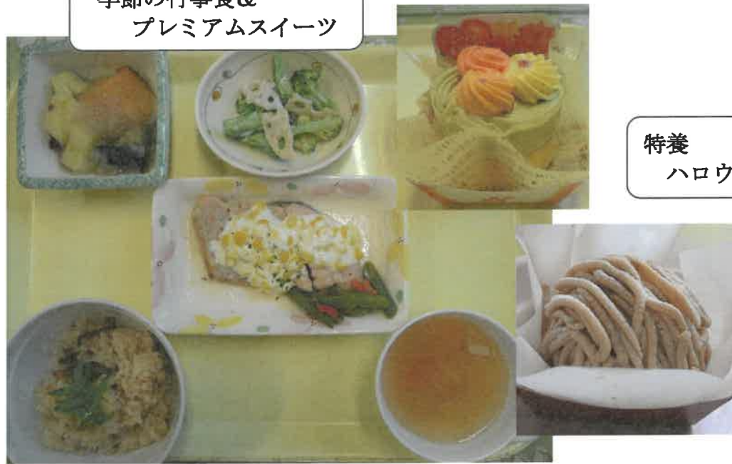
特養 ハロウィンレク