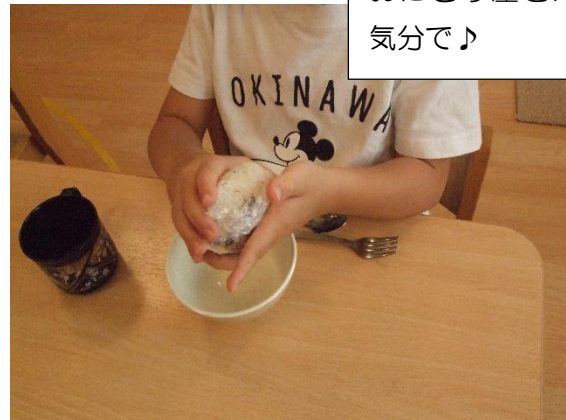
おにぎり屋さんの 気分♪