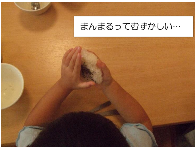
まんまるってむずかしい…