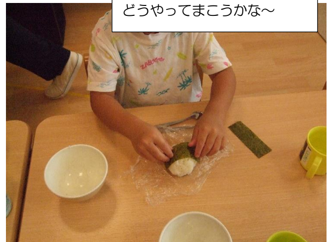
どうやってまこうかな～