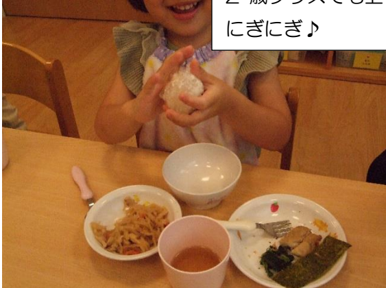
2歳クラスでも上手に にぎにぎ♪