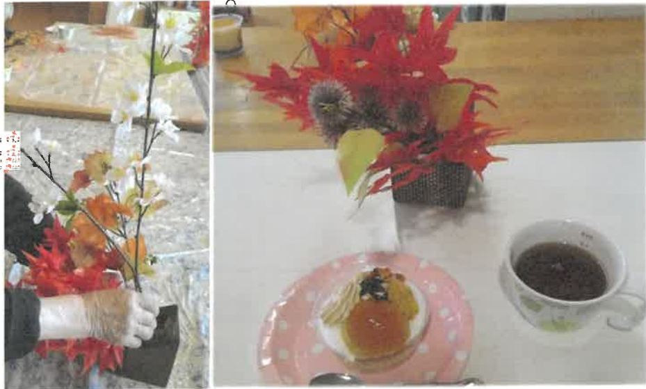
特養 秋のおやつレク