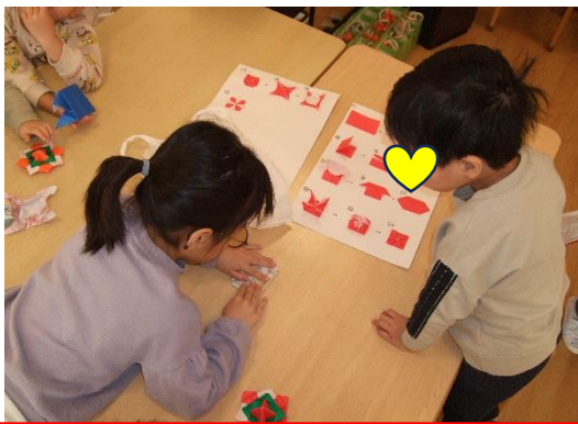
こままわし 折り紙や紙コップで作る自分だけのコマを作ったり、昔ながらのひもで回すこまに挑戦したり！コツを教え合っていました