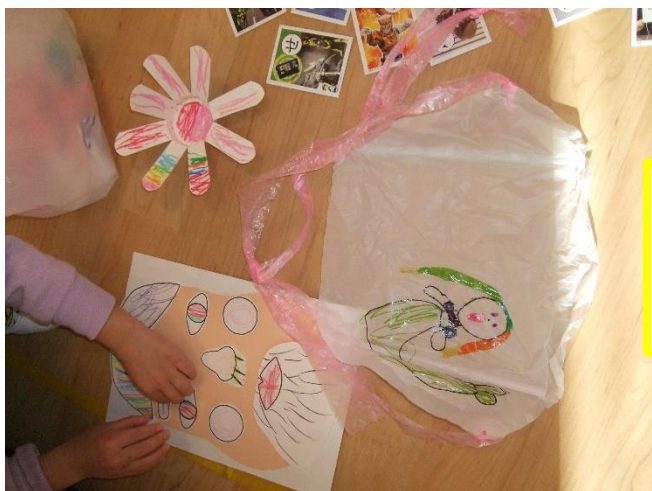
自分の作品袋が日に日に増え、嬉しそうな様子の子も達。「作ったたこをあげるのが楽しみ！」「〇〇ちゃん（弟や妹）のために作ったんだよ」など、この後の楽しみを期待して、ワクワクしていました。