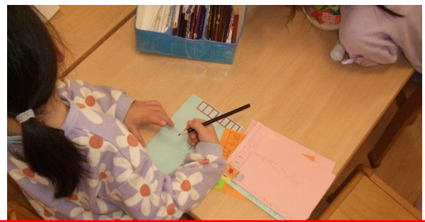
年賀状 お友達や先生、おうちの人などに書きました。書いたらポストに投函♪お返事を待つのも楽しい時間です😊