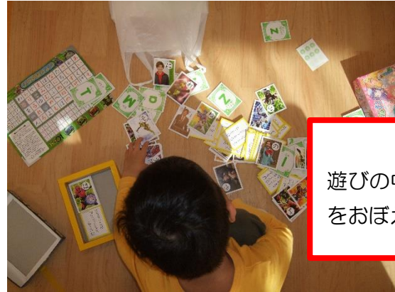
かるた 遊びの中で楽しくひらがなをおぼえています