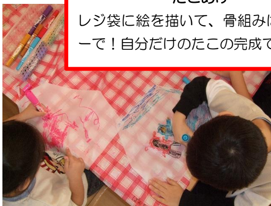
たこあげ レジ袋に絵を描いて、骨組みはストローで！自分だけのたこの完成です！