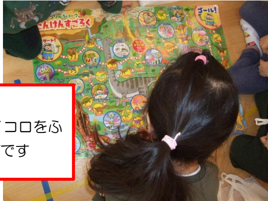
すごろく 順番を待ってサイコロをふるのも新鮮な遊びです

「昔から伝わるお正月らしい遊びをみんなでやってみよう！」と、いろいろな遊びを用意しました。子ども達が自分で選んで参加出来るように保育室を区切ってそれぞれの遊びのブースを作ったところ…どこも大人の予想を上回る大反響！！「むずかし〜」「みせてごらん」など、子ども達同士で教え合ったり手伝ったり♪初めて体験する子も「おうちでやったことあるよ」と教えてくれる子も、みんな楽しそうに参加していました😊「もっとやりた〜い」という子ども達の声が多かったので、その週は「お正月遊びウィーク」ということにして、2歳クラスを招待したり年賀状のお返事を出しあったりしながら毎日楽しく取り組みました♪