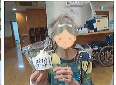
敬老の日の特別メニュー